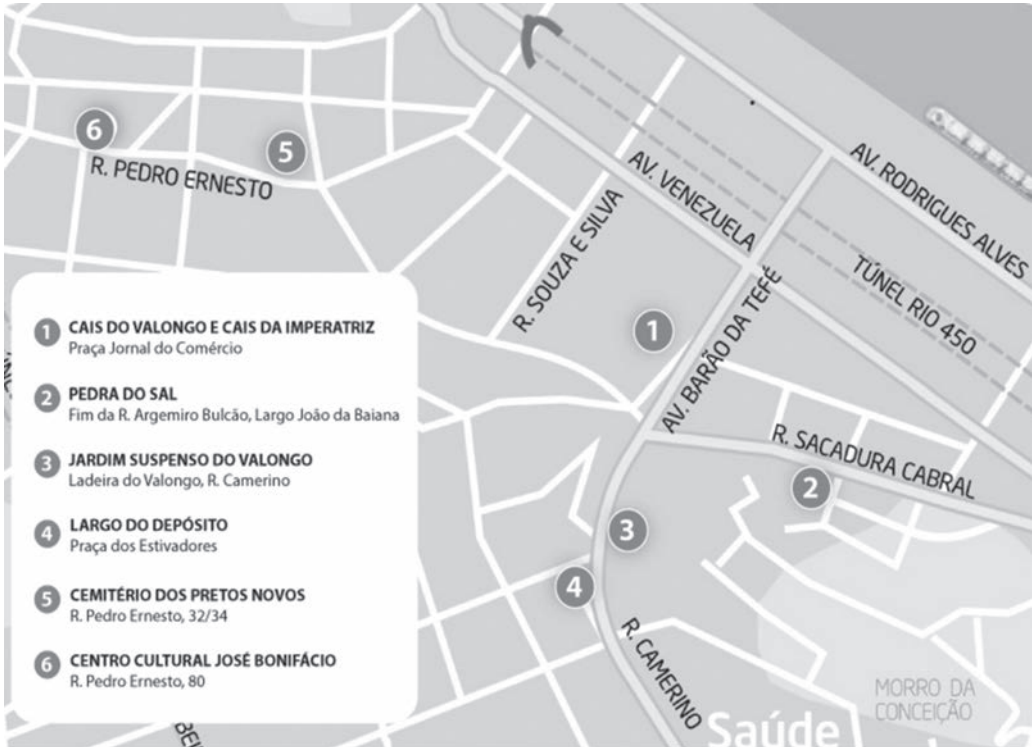
Imagem 1 – Mapa da região portuária do Rio de Janeiro. Fonte: http://www.portomaravilha.com.br/cais_do_valongo . Acesso em 08/10/2016 7 .

Ao invés de um enterro à flor da terra, terá recebido coroas de flores.