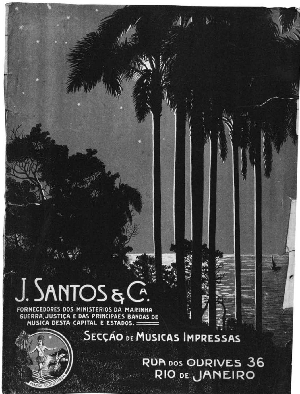
Figura 03 - Anúncio referente à música impressa: “J. Santos & Ca – Secção de Músicas Impressas”. Fonte: Arquivo particular Fred Fagner da Casa Edison do Rio de Janeiro. In: FRANCESCHI, Humberto Moraes. A Casa Edison e seu tempo . Rio de Janeiro: Sarapuú, 2002, CD-ROM 1 – Documentos.