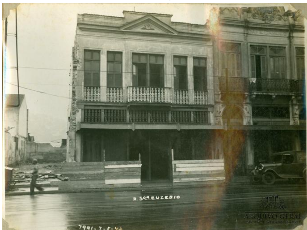
Figura 1 – Demolições em curso para a abertura da Avenida Presidente Vargas na rua Senador Euzébio, arredores da Praça Onze de Junho. Provável Uriel Malta, 7 mai. 1942.